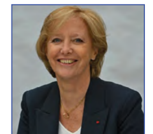
Sophie CLUZEL, Secrétaire d'État auprès du Premier ministre, chargée des Personnes handicapées