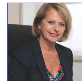
Brigitte BOURGUIGNON, Ministre déléguée auprès du ministre des Solidarités et de la Santé, chargée de l'Autonomie