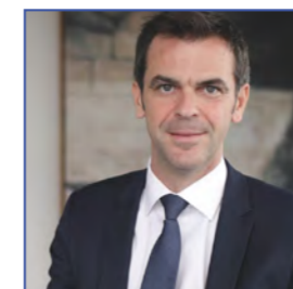
Olivier VÉRAN, Ministre des Solidarités et de la Santé