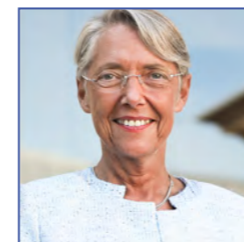
Élisabeth BORNE, Ministre du Travail, de l'Emploi et de l'Insertion